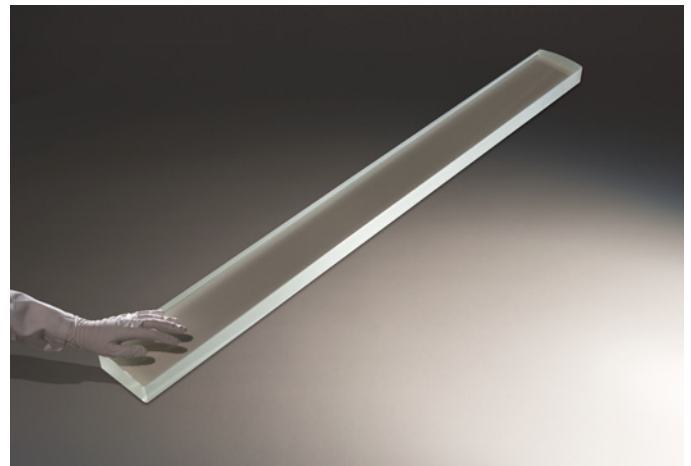
Große Zylinderlinse (bis 2.000mm, zylindrisch und plan) für Laser Annealing und Laser Lift-Off

Wir haben für die Vermessung von großformatigen Plan- und Zylinderlinsen eigene innovative Messverfahren entwickelt und setzen unter anderem die Stitching-Methode ein.