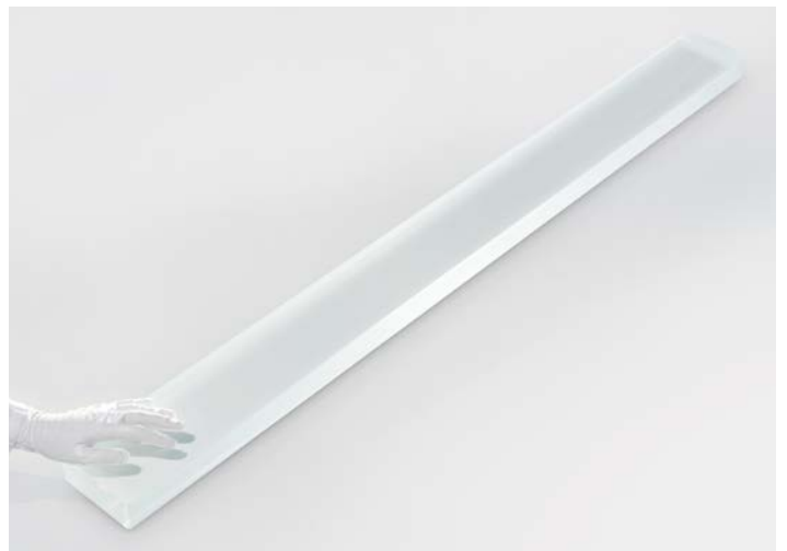
Große Zylinderlinse (bis 2.000mm, zylindrisch und plan) für Laser Annealing und Laser Lift-Off

Wir haben für die Vermessung von großformatigen Plan- und Zylinderlinsen eigene innovative Messverfahren entwickelt und setzen unter anderem die Stitching-Methode ein.